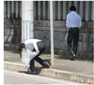
地域清掃活動の様子